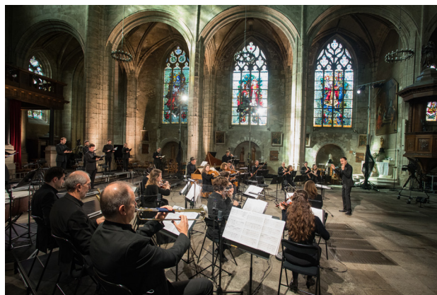
Photo concert Église Saint-Germain, 30 mars 2021

Ensembles en résidence à l'Opéra de Rennes