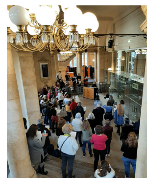
photo A chœur ouvert 2022

À l'Opéra de Rennes. Gratuit, sur inscription